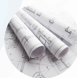
Bureaux d'études/ Contrôle de pro- duction/Travaux d'ingénierie